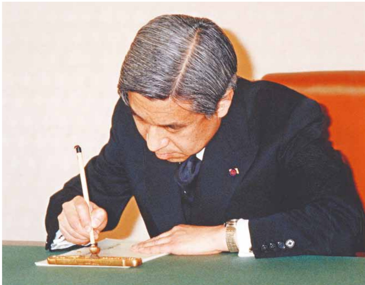
元号を「平成」に改める政令の書類に署名される天皇陛下 =1989年1月7日、宮殿・鳳凰の間

で、孝徳天皇即位時(645年)の「大化」とされる。それ以前は中国の元号をそのまま用いたり、干支で時間を表したりしていた。701年、大宝律令で元号使用が制度化された。その後、皇位継承の立し、再び法的に裏付けられた理由として改められた。